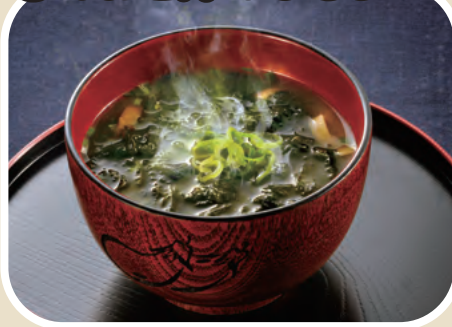
② あおさ汁のふるまい

車内では、志摩市観光協会による志摩市の特産品「あげあられ」、「あおさ潮ようかん」、「あかもく細うどん」など 志摩ブランド認定品を中心に販売します。