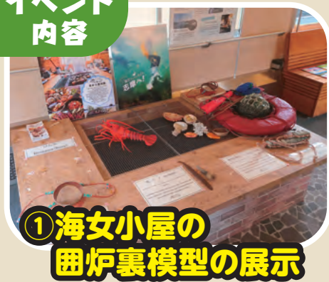
① 海女小屋の 囲炉裏模型の展示