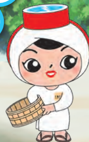
志摩市の観光PRキャラクター しまこさん