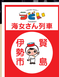
海女さん列車ヘッドマーク