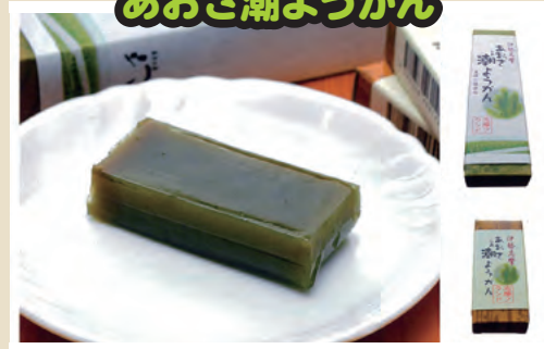
あおさ潮ようかん