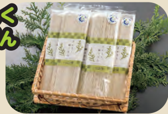
あかもく 細うどん