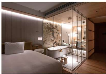
ザ・リッツ・カールトン福岡