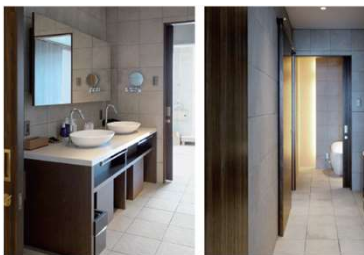
鹿児島 砂むし温泉 指宿白水館 花の棟