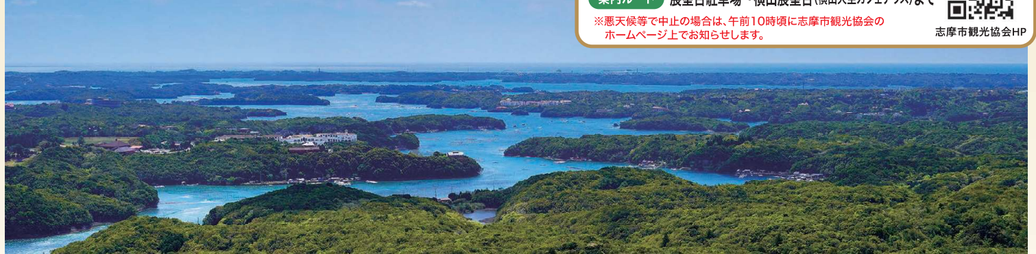
横山展望台からの英虞湾の眺め